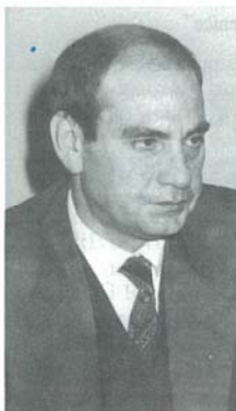
Il Presidente Di Carlo

Da alcune settimane è in funzione il nuovo impianto di illuminazione del porto di Ravenna. L'interruttore è stato simbolicamente azionato per la prima volta dall'Autorità Portuale che ha colto l'occasione per organizzare una iniziativa promozionale alla quale hanno partecipato, insieme ai principali operatori portuali e alle autorità, anche i vertici delle più importanti compagnie armatoriali del mondo: Msc, Zim, Maersk, Sarlis, Ever-