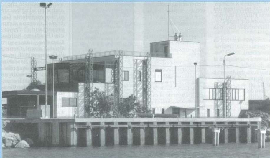
La nuova palazzina con l'attracco per i natanti