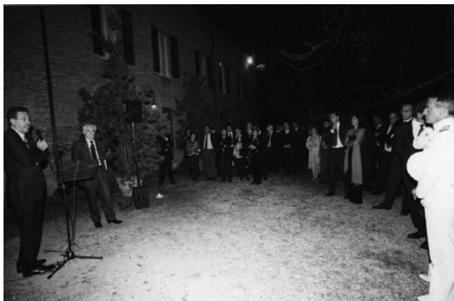
Il saluto delle autorità

crescono in fatturato e stima sul mercato. È una soddisfazione vedere incrementare il numero dei collaboratori che vorrei sereni nell'operare, perché consapevoli della considerazione di cui godono ed orgogliosi di far parte del team aziendale".